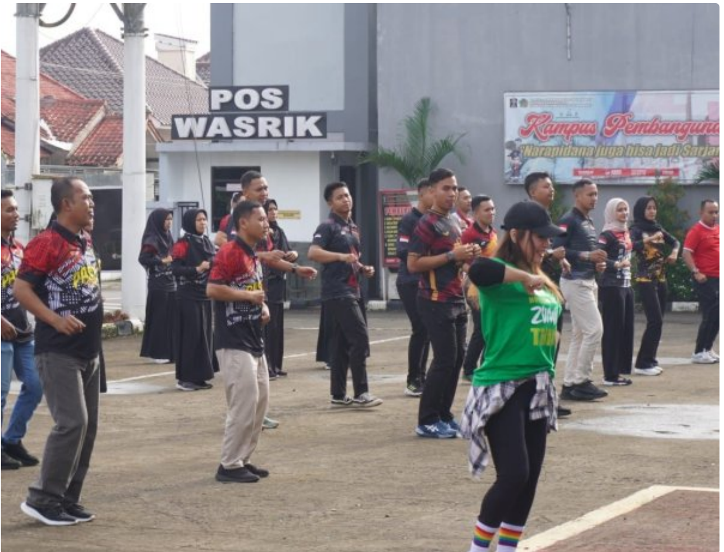
Jaga Kebugaran Tubuh, Pegawai Lapas Kelas IIA Purwokerto Senam Pagi Bersama

PURWOKERTO - Kegiatan senam pagi ini dilaksanakan di halaman gedung utama yang dimulai pukul 07.45 yang dipandu oleh instruktur profesional. Kegiatan ini diikuti oleh Kalapas dan seluruh pegawai Lapas Kelas IIA Purwokerto, pada Sabtu (25/1/2025).